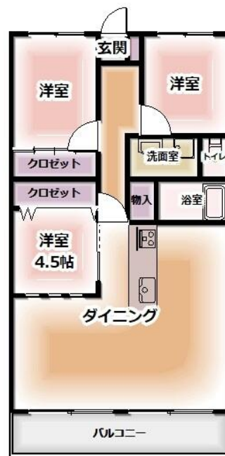
※間取りは現況を優先